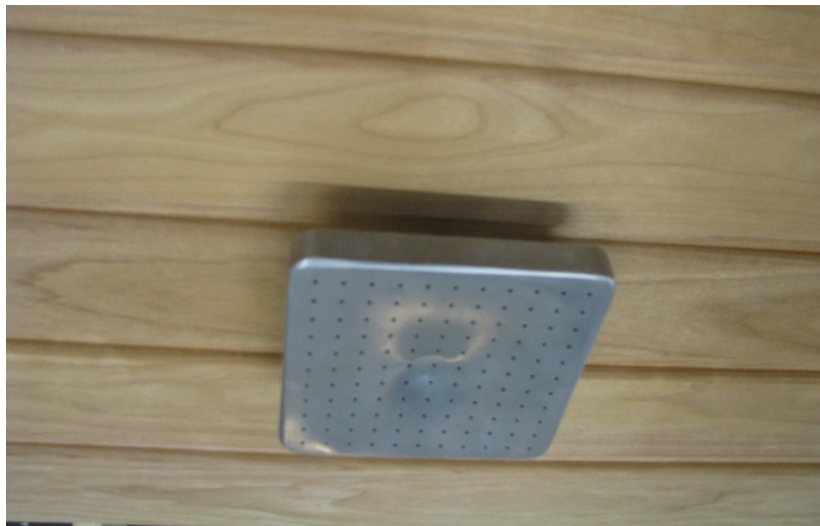
Kuva 6: sadettajan asennus hanakulmarasiaan, kattoon.