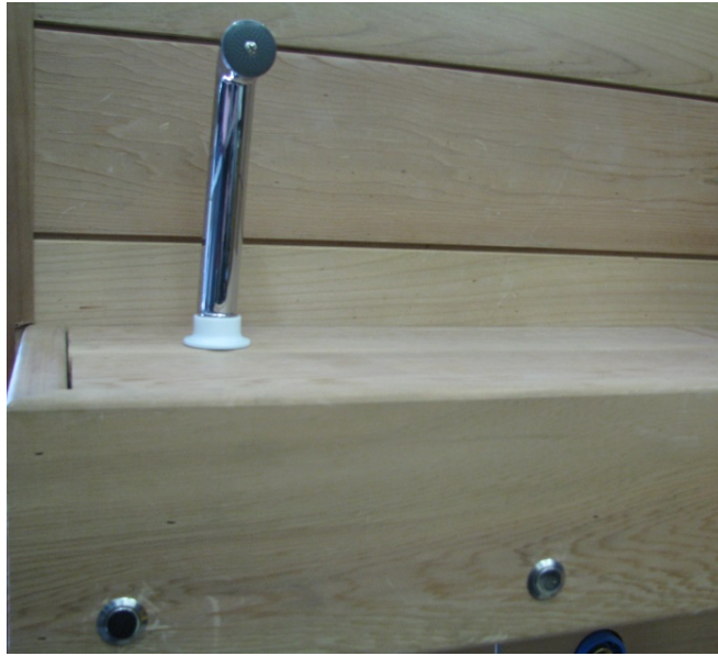
Kuva 5: painonapit ja bidesuihku asennettuna lauteisiin