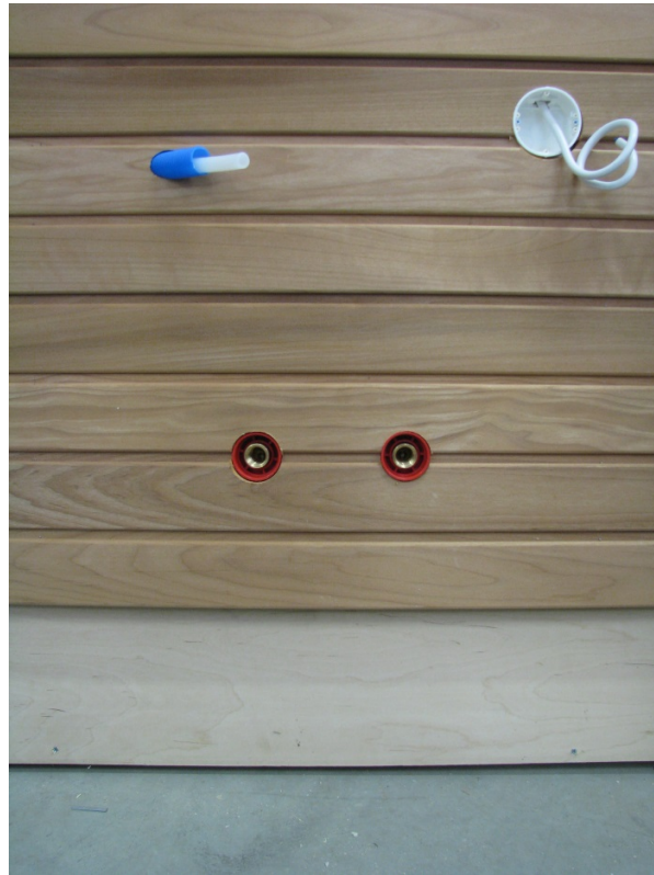
Kuva 3: veden ja sähkönsyöttö asennettuna saunan paneloinnin alle.