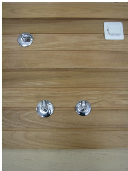
Kuva 4: suojakannet asennettuna liitoksiin