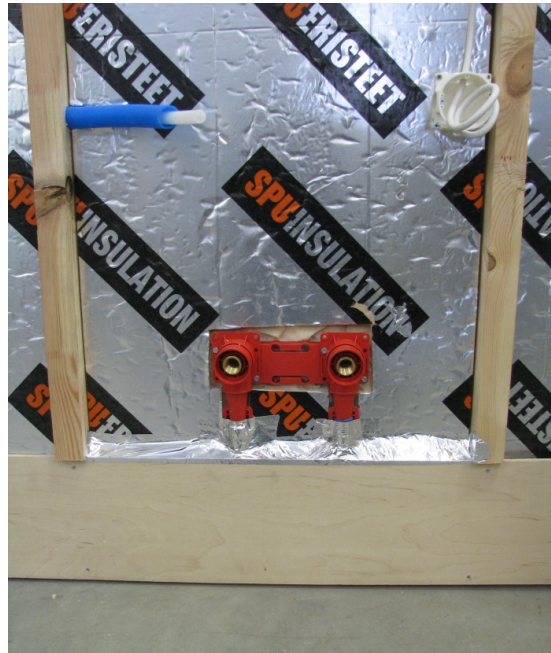
Kuva 1: Esivalmistelut ennen asennusta. Kuvassa sähkönsyöttö sekä vedensyötöt asennettuna saunan seinärakenteisiin