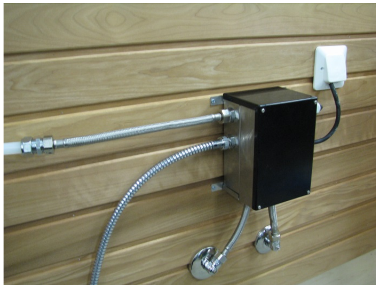
Kuva 8 : ohjausyksikkö asennettuna toimintavalmiiksi